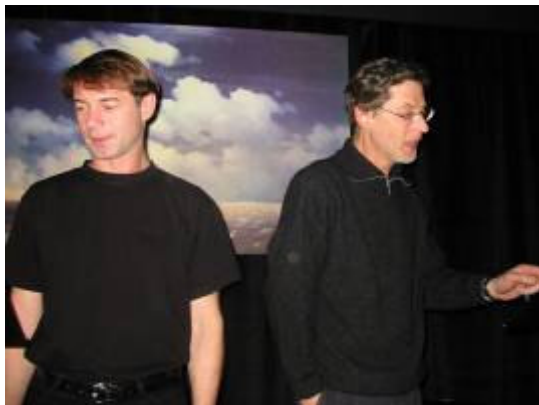
Adresát neznámý: J. Dvořák, J. Hartl

Všechny tyto akce probíhaly za účasti lidických žen a dětí i dalších občanů z obce Lidice a okolí.