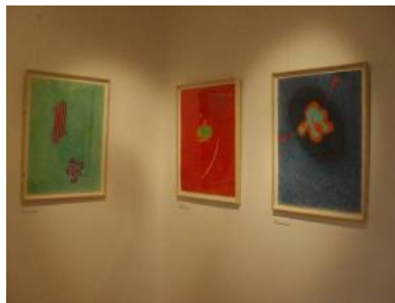
Pohled do expozice výstavy - pastely a drátěná plastika.