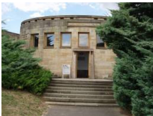
Výstavní síň In Memoriam

Ve výstavní síni Pod tribunou proběhla v prvním pololetí výstava „Koncentrační tábory“, ve druhém pololetí výstava „Totálně nasazení“. Ve výstavní síni IN MEMORIAM měli návštěvníci Památníku Lidice možnost zhlédnout v prvním pololetí výstavu „Rehabilitace PL 2001-2005“, o letních prázdninách výstavu „Beslanská tragédie“ a od září do poloviny prosince výstavu „Totálně nasazení“. 19. prosince byla v tomto prostoru zahájena výstava „Návrat lidických dětí“.