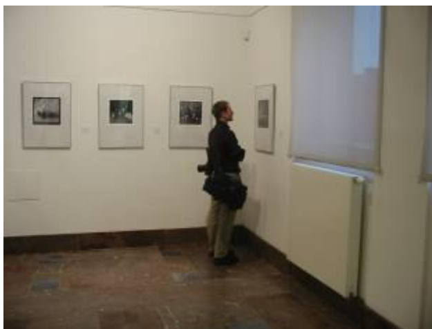
Pohled do expozice výstavy.