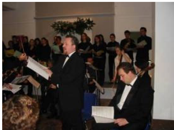
Česká mše vánoční