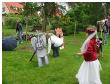
Součástí vernisáže byl i bohatý doprovodný program: vystoupení Dětského sboru „Sluníčko“ z 5. ZŠ Kladno, divadelní představení kladenského Divadélka U Zvonu „Jak kašpárek hastrmana ošidil“ a soutěže pro děti i dospělé.