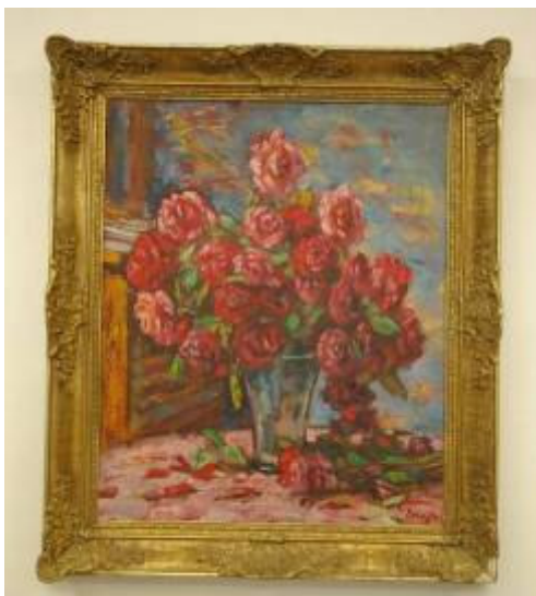
V. Beneš – Váza s růžemi

V přízemí Lidické galerie je vystavena část „Lidické sbírky“, kde si návštěvníci mohou prohlédnout díla darovaná Lidicím od umělců z celého světa. V 1. patře Lidické galerie našla své místo „Mezinárodní dětská výtvarná výstava Lidice“. V roce 2006 zde byly vystaveny vybrané výtvarné práce, které děti z celého světa zaslaly do 34. ročníku MDVV. K vyplnění období mezi jednotlivými ročníky MDVV je 1. patro galerie využíváno ke krátkodobým výstavám zejména současného umění.