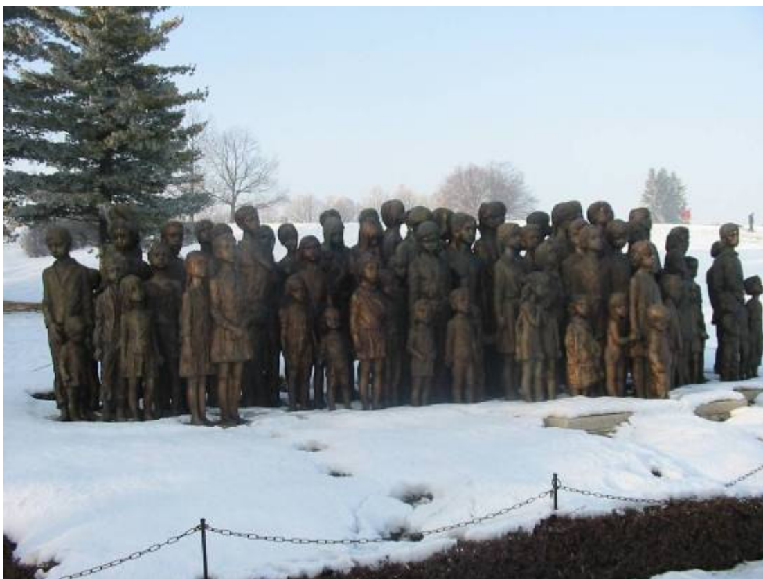
Pomník dětských obětí války